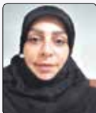
توحید لوروز نامه نگار

شورای شهر مجلسی محلی در سطح شهر است که نمایندگان آن توسط همان شهر انتخاب می شوند. وظیفه اصلی این مجلس: انتخاب شهردار، تصویب بودجه و نظارت بر عملکرد شهرداری است. شهرداری یکی از مهم ترین نهادهای شهری به ویژه در کلانشهرها می باشد که مسئولیت ها و وظایف زیادی بر عهده دارد و می تواند در زندگی شهروندان تأثیرات زیادی داشته باشد. این نهاد عمومی غیر دولتی موظف است، ضمن رعایت حاکمیت قانون به حقوق شهروندان به عنوان اعضای جامعه احترام گذاشته و تصمیماتش نیز باید قانونی باشد و مؤلفه های حقوق شهروندی از جمله حقوق مدنی، سیاسی و اجتماعی را رعایت کند.