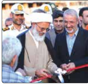
ایشان کرد و در خصوص رفع این مشکلات دستورات لازم را صادر کرد.

توجه ویژه به مناطق کمبر خوردار کیانی با تأکید بر اهمیت توجه به مناطق کمبر خوردار، گفت: در این دوره از مدیریت شهری، تلاش کرده ایم تا نگاه ویژه ای به محله هایی داشته باشیم که در گذشته کمتر مورد توجه قرار گرفته اند. به عنوان مثال، پروژه تکمیل بلوار ناصر بخت که سال ها نیمه کاره رها شده بود، اکنون به بهره برداری رسیده است. شهردار کرج همچنین به موضوعات دیگری مانند ساماندهی بازار هفتگی محله جوادآباد، جمع آوری نخاله ها که از درخواست اهالی محله جواد آباد بود