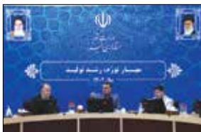
دستگاه‌های اجرایی مکلف به ثبت موتورخانه‌های ساختمان‌های خود در سامانه اداره کل استاندارد و اخذ گواهینامه از عملکرد موتورخانه‌های خود شدند.

نیر و گاه منتظر قائم، برنامه‌های کاهش آلودگی هوا برای پاییز و زمستان پیش رو ارائه دهد. درگی مدیر کل حفاظت محیط زیست استان گفت: دومین کارگروه کاهش هوای کلانشهرها در استان البرز با تاکید بر کنترل آلودگی منابع عمده استان در فصل سرد سال برگزار شد. کارگروه کاهش آلودگی هوا به ریاست افضل‌ی معاون هماهنگی امور عمرانی استانداری برگزار شد نیر و گاه منتظر قائم موظف شد برنامه کاهش آلودگی را ارائه دهد. تأمین گاز سیمان آبیگ نیز به شرکت گاز استان تکلیف گردید. براساس ماده ۱۷ قانون هوای پاک کلیه