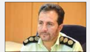
معاون فرهنگی و اجتماعی فرمانده انتظامی استان البرز با اشاره به دستگیری دو تن از اراذل و اوباش شناخته شده در شهر کرج

گفت: این افراد در فضای مجازی رجز خوانی و قدرت‌نمایی می‌کردند. سرهنگ سعید مرتضی موسوی گفت: مأموران پلیس اطلاعات و امنیت عمومی استان در حین رصد فضای مجازی با رجز خوانی و قدرت‌نمایی دو نفر از اوباش سطح دار و سابقه دار استان در این فضا مواجهه و اقدامات لازم برای برخورد با این افراد را آغاز کردند. وی با اشاره به اطلاع این افراد از تحت