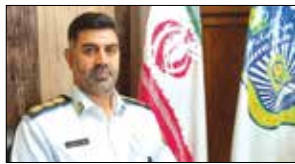
ایم‌نی در حفظ سلامتی راکبان و سرنشینان موتورسیکلت‌ها غیر قابل انکار است.

رئیس پلیس راهور استان البرز از فوت دو جوان به دلیل واژگونی موتورسیکلت در محدوده شاهین ویلا کرج خبر داد. سرهنگ حمدالله رحمتی پور در گفت‌وگو با خبرنگار مهر اظهار کرد: به دنبال دریافت گزارشی از طریق مرکز فوریت‌های پلیسی ۱۱۰ مبنی بر وقوع حادثه واژگونی موتورسیکلت در محدوده میدان باهنر شاهین ویلا کرج، بلافاصله عوامل