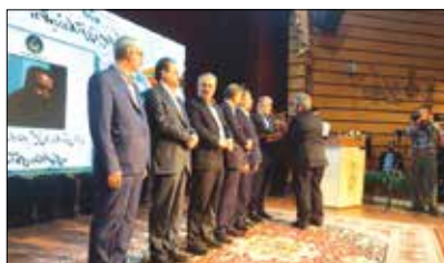
بین دستگاه‌های اجرایی استان شد.

استاندار البرز شده است. البرزی با بیان اینکه مدیریت خدمات کشوری به منظور ارزیابی عملکرد دستگاه‌ها در راستای تحقق اهداف و وظایف محول شده و نیز تکالیف تعیین شده در برنامه اصلاح نظام اداری، افزود: جشنواره شهید رجایی سال ۱۴۰۱ با شرکت بیش از ۵۱ دستگاه اجرایی در سطح استان البرز برگزار گردید. وی خاطر نشان کرد: با مساعی و تلاش‌های مجموعه مدیران و کارکنان امداد امام (ره) استان، این اداره کل بار دیگر موفق به کسب تقدیرنامه و تندیس ویژه جشنواره شهید رجایی سال ۱۴۰۱ در