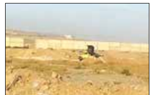
دو دستگاه خوردرویی حمل نخاله که اقدام به تخلیه غیر مجاز در محدوده مسکن مهر ماهدشت می نمودند طی گشت نامحسوس

توسط مامورین محیط زیست کرج شناسایی شدند. تونی رئیس اداره حفاظت محیط زیست کرج با اعلام این موضوع افزود هر گونه تخلیه خاک و نخاله و پسماند در محلهای غیر مجاز، تخلف محسوب شده و قابلیت پیگیری قضایی دارد. وی از هموطنان درخواست نمود گزارشات خود را در این زمینه با این اداره از طریق سامانه ۱۵۴۰ و یا با این شماره تلفن‌ها ۳۲۵۰۴۹۶۲ و ۳۲۵۰۴۹۶۲ مطرح نمایند.