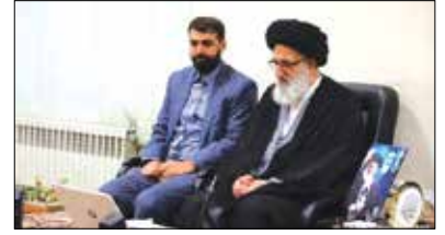
نشست شورای فرهنگ عمومی کشور به ریاست محمد مهدی اسماعیلی وزیر فرهنگ و ارشاد اسلامی و با حضور ویناری حجت الاسلام والمسلمین حسینی همدانی نماینده رهبر معظم انقلاب اسلامی در استان البرز برگزار شد

حجت الاسلام والمسلمین حسینی همدانی در این نشست ضمن عرض تبریک به مناسبت فرارسیدن ماه ربیع الاول، اظهار داشت: امیدوارم