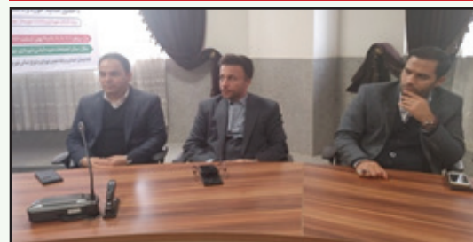
برگزاری جلسه جهاد تبیین