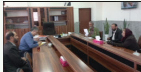
ملاقات مردمی شهردار چهارباغ