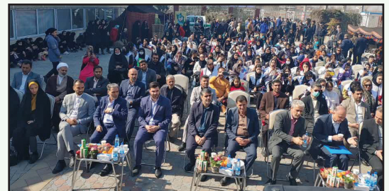
روز فر هنگی چهارباغ و جشنواره گل پامچال