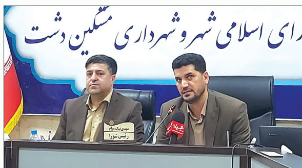
انجام شده و بیش از ۲۰ پروژه شاخص برنامه ریزی شده است. ما توانستیم با حمایت مسئولین ۶ دستگاه اتوبوس خریداری کنیم که به وضعیت حمل و نقل شهروندان کمک می کند.

در نشست خبری که با حضور شهردار و رئیس اعضای شورای اسلامی شهر مشکین دشت برگزار شد، دکتر مهدی نیک مرام رئیس شورای اسلامی مشکین دشت ضمن تأکید بر خدمات رسانی به شهروندان و ارتقاء امکانات شهری، گفت: در بودجه سال جدید ۲۹۰ میلیارد تومان بودجه ۱۴۰۲ بسته شد که ۶۱ درصد به پروژه های عمرانی و ۳۹ درصد به پروژه های جاری اختصاص داده شد. مهندس صفرخانلو شهردار مشکین دشت گفت: بیش از ۶۰ درصد املاک قولنامه ای است که درآمد شهرداری را تحت تأثیر قرار داده است و امانت به سال گذشته ۶۲ درصد افزایش بودجه داشتیم. وی افزود: هدف گذاری خوبی