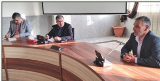
دیدار با خانواده معظم شهدا، اینارگران جانبازان شاغل در شهرداری