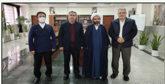
بازدید مدیر کل حراست استانداری البرز از شهرداری چهارباغ