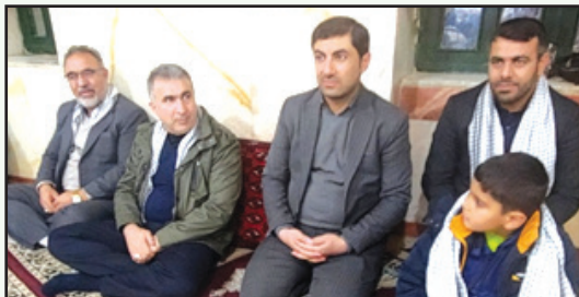
یادواره شهدا در روستای عرب آباد خسروی