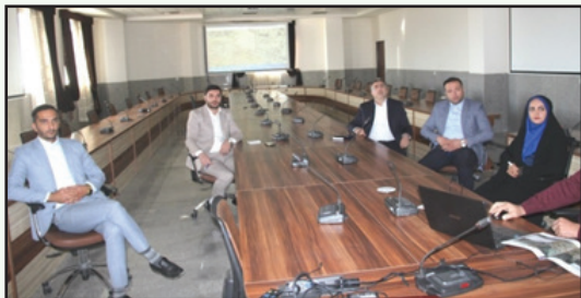
جلسه طرح تفصیلی به اتفاق اعضای شورای اسلامی شهر