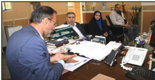
بازدید شهردار و اعضای شورا از مرکز تعویض پلاک شهر چهارباغ