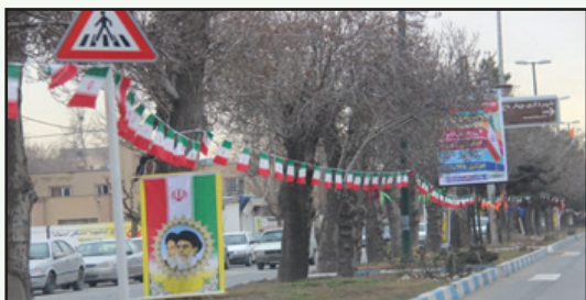
آذین بندی ویژه مراسم ایام ا... دهه فجر