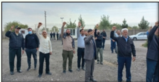
محکوم نمودن عاملین حادثه در شاهچراغ شیراز