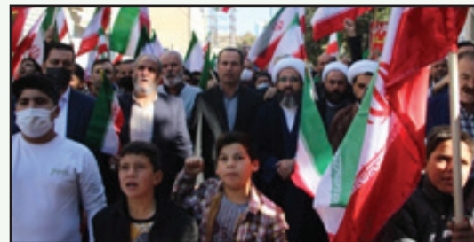
مراسم روز ۱۳ آبان در شهرستان چهارباغ