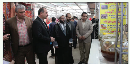
نمایشگاه صنایع دستی و سوغات شهرهای کشور در چهارباغ