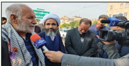
نامگذاری یکی از معابر شهر چهارباغ به نام شهید روح الله عجمیان