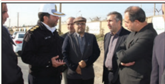
ساماندهی ترافیکی بلوار پیام با حضور فرماندار، اعضای شورا و سرهنگ کرمی رییس پلیس راهور استان البرز