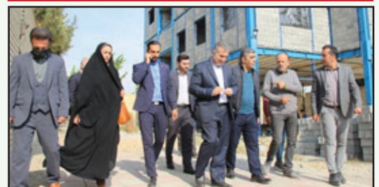
بازدید از پروژه های سطح شهر چهارباغ و نواحی