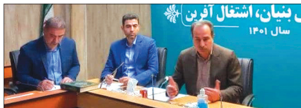
از دواج، وام فرزندآوری، وام اشتغال ماده ۱۶ و ۱۸ و ... ارسال شود. نماینده عالی دولت