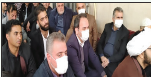
شرکت در مراسم روز بصیرت و میثاق امت با ولایت (۹ دی)