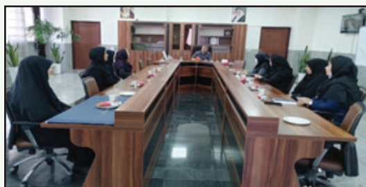
جلسه با بانوان شاغل در شهرداری