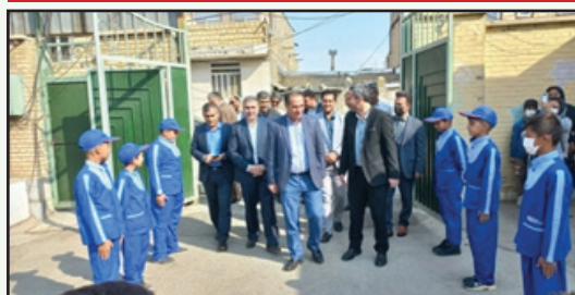
بازدید از عملیات پدافند غیر عامل در مدرسه ایمان