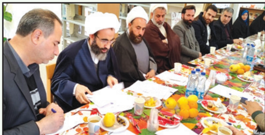
همایش هفته کتاب و کتابخوانی در کتابخانه آدینه ملک آباد