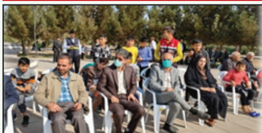
اجرای عملیات پدافند غیر عامل در بوستان مهدی آباد