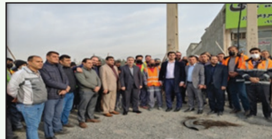
چهارشنبه جهادی مشترک با شهرداری کمالشهر