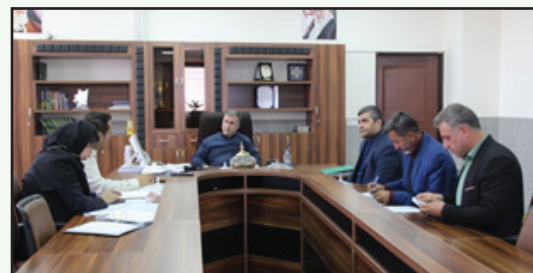
برگزاری جلسه کمیته عمرانی