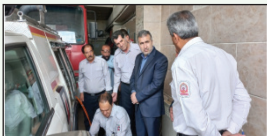
بازدید از حوزه معاونت خدمات شهری