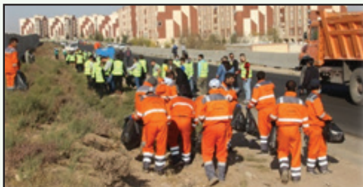
طرح جهادی پاکسازی و باسداشت طبیعت در چهارباغ