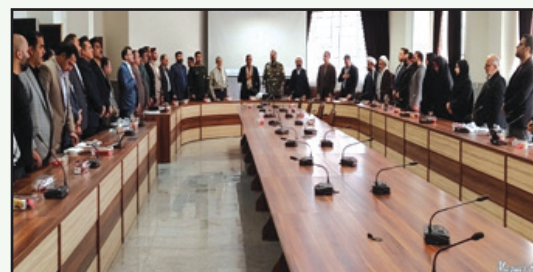
تجلیل از بسیجیان شهرداری با حضور سرداران باهک و نظام اسلامی