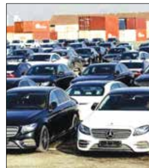
نایب رئیس کمیسیون عمران مجلس شورای اسلامی، تأکید کرد: با ساز و کاری که برای واردات

مجوز واردات خودرو و انحصاری شده است ، وی در ادامه با بیان اینکه در زمان رای اعتماد و زمان