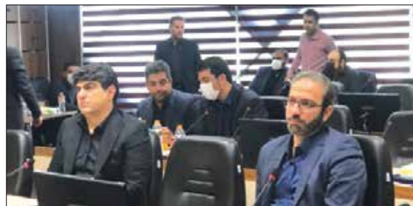
باهدف تعامل، توانمندسازی و انتقال تجارب استان‌ها با مجمع شهرداران کلان‌شهرهای ایران

و تقویت نظام مدیریت شهری برگزار شد. این مسئول در ادامه به تشریح عناوین مطرح شده در اولین نشست هم‌اندیشی و مدیریت دانش در مدیریت ترافیک شهری و حمل و نقل عمومی کشور پرداخت و افزود: از جمله این عناوین می‌توان به مباحث ترافیک شهری، ارتباط ترافیک و آلودگی هوا، ارتباط معاینه فنی صحیح و آلودگی هوا و ساخت تقاطعات غیر هم‌سطح و تأثیر آن در ترافیک شهری اشاره کرد. به گفته فرهاد، این نشست با حضور روسای کمیسیون عمران و حمل و نقل و ترافیک شوراهای اسلامی مراکز استان‌ها و معاونان حمل و نقل و ترافیک شهرداری‌های مراکز استان‌ها برگزار شد.