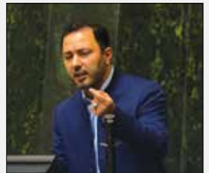
مهدی عسگری نماینده مردم کرج در مجلس

شورای اسلامی و طرح سوال از وزیر بهداشت سوالات عقلانی و مخمی را مطرح کرد که در نهایت وزیر توضیح مشخصی برای آن نداشت. مهم ترین سوالاتی که وزیر بهداشت کماکان پاسخی در خصوص آن ارائه نکرده است: ۱- رهبر انقلاب به صراحت اشاره کردند که قرآنی وجود دارد که این بیماری طبیعی نیست و احتمال حمله بیولوژیکی وجود دارد، ستاد کرونا و کمیته علمی چه اقدامی روی موضوع مذکور انجام دادند؟ ۲- آقای عین اللهی زمانی که وزیر بهداشت نبودید در نامه ای به همراهِ ۲۵۰ نفر از پزشکان اعلام کردید