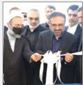
در مراسمی با حضور رئیس کل دادگستری استان البرز، معاونین توسعه حل اختلاف و اجتماعی و پیشگیری از وقوع جرم، رئیس کل دادگاه های عمومی و انقلاب مرکز استان، مدیر

کل فرهنگ و ارشاد اسلامی و جمعی از اصحاب رسانه استان در محل اداره کل فرهنگ و ارشاد اسلامی استان البرز، کمتر از ۲۲ ساعت پس از توصیه رئیس قوه قضائیه به اصحاب رسانه، مرکز رسانه قوه قضائیه و مرکز توسعه حل اختلاف برای تشکیل «شورای حل اختلاف ویژه رسانه»، این شورا در استان البرز افتتاح و آغاز به کار کرد. حسین فاضلی هر یکدی در حاشیه آیین افتتاح «شورای حل اختلاف ویژه رسانه استان البرز» گفت: این شورا با هدف تکریم اهالی رسانه استان و استفاده از ظرفیت آنها برای انجام مذاکرات اصلاحی و ایجاد صلح و سازش در پرونده های مربوط به رسانه، با همکاری معاونت توسعه حل اختلاف و مدیریت روابط عمومی و ارتباطات دادگستری کل استان و نیز اداره کل فرهنگ و ارشاد اسلامی و خانه مطبوعات استان البرز تشکیل شد.