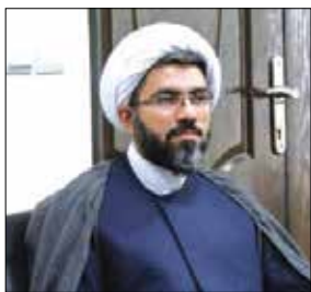
پرخیر و برکت می شوند، کارکردهای گسترده اجتماعی با بازتاب جهانی دارد.

مردم امسال حضور حداکثری داشته باشند و در این مراسم معنوی و بزرگترین همایش سیاسی و مذهبی شرکت نمایند. وی بر لزوم پشتیبانی فرهنگی از پدیده پیاده روی اربعین تأکید کرد و گفت: پیاده روی اربعین در به تصویر کشیدن جایگاه عاشورا و مهدویت، بیشتر از هر کار فرهنگی و هنری تأثیر گذار است. رئیس کمیسیون فرهنگی، اجتماعی و ورزشی شورای اسلامی شهر کرج یادآور شد: آثار و برکات اربعین دارای جنبه ها و ابعاد متعدد و مختلفی است و علاوه بر اثرات معنوی در تک تک افرادی که رهسپار این سفر