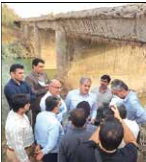
پل ها و آبراههای حوزه استحفاظی راههای البرز نیز انجام شد.

محبتی جانعلی توسعه و افزایش کیفیت زیر ساخت های ورزشی روستاهای استان را امری مهم و در دستور کار برای این اداره کل، ارزیابی کرد. محبتی جانعلی مدیرکل ورزش و جوانان استان البرز در حاشیه مراسم افتتاحیه مسابقات مینی فوتسال روستاییان و عشایر استان البرز «جام پرچم» اظهار کرد: برگزاری رقابت های ورزشی در بین روستاییان و عشایر بسیار با اهمیت است و ما در اداره کل ورزش و جوانان استان البرز از آن استقبال می کنیم. وی با بیان این که «در تلاش هستیم کیفیت زیر ساخت های ورزشی روستاها توسعه و افزایش یابد» گفت: هیئت ورزش روستایی و بازیهای بومی محلی جزو هیئتهای ورزشی پیشگام و بسیار پویا و فعال استان البرز است. جانعلی افزود: استعدادهای خوبی در ورزش روستا وجود دارند که با کشف و پرورش صحیح می توانند به قهرمانان ملی تبدیل شوند. وی ادامه داد: برگزاری چنین رویدادهایی علاوه بر ارتقای سطح سلامت و پویایی جوانان می تواند موجب ارتقای نشاط و شادابی اجتماعی گردد. مدیرکل ورزش و جوانان استان البرز تصریح کرد: با هر آنچه در توان داریم از توسعه ورزش روستایی در سطح استان حمایت خواهیم کرد.