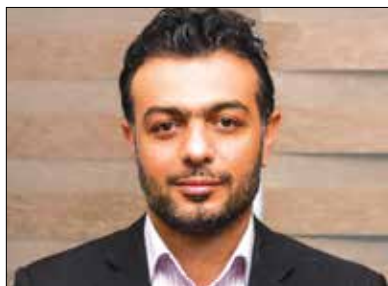
سازمانی و حفظ و توسعه رفتار و عملکرد مطلوب کارکنان جهت بررسی پیشنهاد شد.

کارکنان دولت (همانند دستورالعمل چگونگی اجرای قانون نظام هماهنگ پرداخت کارکنان برخی نهادها، اصلاح بندهای شمول کشور بازنشستگی (درصدی از حقوق و مزایا برای حق بیمه) برای تامین پوشش بازنشستگی مستخدمین کارمندی شهرداریها، تدوین آیین نامه همسان سازی نظام پرداخت حقوق در کلیه شهرداریهای کشور جهت رفع تبعیض بین تمام کارکنان شهرداریهای کشور، بازنگری رسته ها و رشته های شغلی کارکنان شهرداری با توجه به طرح طبقه بندی و ارزشیابی مشاغل مستخدمین دستگاه های اجرایی و تدوین آیین نامه جهت نظام جبران خدمات در شهرداریهای کشور با هدف تشویق کارکنان و بهبود اثربخشی سازمان با دریافت پاداشهای مالی و غیرمالی در راستای مدیریت مطلوب منابع انسانی، برقراری عدالت، جذب، حفظ و توسعه استعدادهای