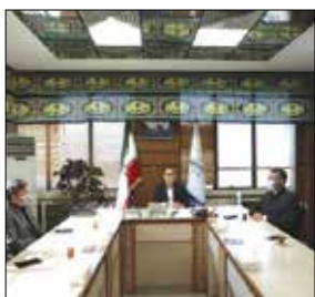
را در دستور کار خود دارد، افزود: می توان با برنامه ریزی مطلوب و ارائه راهکارهای مناسب، این برنامه ها را گسترش داد.

کرد: این برنامه ریزی مناسب، مدیریت شهری را در رسیدن به اهداف و سیاست های خدماتی، رفاهی و ورزشی یاری می کند. معاون شهردار افزود: ورزش همگانی نیازمند زیرساخت آنچنانی نیست و با کمترین هزینه می توان سلامت را به جامعه تزریق کرد. وی با اشاره به اینکه سازمان فرهنگی و ورزشی و اجتماعی شهرداری کرج هر روز در پارک ها و بوستان های سطح شهر اجرای برنامه ایستگاه ورزش همگانی و ورزش صبحگاهی