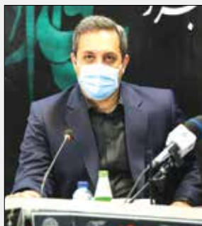
و جلسات آنلاین بیشتری با حضور تجار دیگر کشورها برنامه‌ریزی شود.