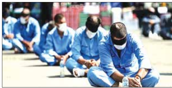
سارقان شناسایی شده و پس از اخذ دستور مقام قضائی، باند ۶ نفره سارقان در یک عملیات ضربتی

سرهنگ محمد نادر بیگی گفت: در پی وقوع چند فقره سرقت تحت عنوان مامور در سطح شهرستان کرج، موضوع به صورت ویژه در دستور کار پلیس آگاهی استان قرار گرفت. او گفت: تحقیقات اولیه حاکی از این بود که سارقان به صورت چند نفره با سوء استفاده از البسه تجهیزات نظامی جعلی، به بهانه همراه داشتن مواد مخدر اقدام به بازرسی خودرو و مالباختگان کرده و با تهدید آن ها اقدام به اخذی و زورگیری کرده و از محل متواری می شدند. رئیس پلیس آگاهی البرز عنوان کرد: با تلاش شبانه روزی کارآگاهان پلیس آگاهی و انجام اقدامات گسترده پلیسی-اطلاعاتی، سرانجام