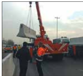
از مخاطرات احتمالی تأثیرات بسزایی در عبور و مرور وسایل نقلیه و کاهش تصادفات خواهد داشت.

جهادی منطقه در محدوده حاشیه بزرگترین محور مواصلاتی استانی پرداخت و تصریح کرد: همچنین به منظور زیبایی بصری حاشیه اتوبان تعداد یک هزار و ۵۰۰ اصله نهال در فضای مستعد و خالی حاشیه این بزرگراه در قالب جنگلکاری و ایجاد دیوار سبز کاشته می‌شود. وی ادامه بیان کرد: این پروژه بسیار حائز اهمیت بوده و جهت ایمن سازی و پیشگیری