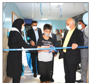
مراسم افتتاحیه بخش هیدروتراپی شبانه روزی

جای خالی همه کسانی را که با حمایت های خود چتری بر سر مددجویان گسترده را احساس کرده و آرزوی کنیم این روزهای سخت کرونایی تمام شود و دوباره عشق و مهر سایه ای بر سر مددجویان بگستراند. در پایان مراسم ریان افتتاحیه واحد هیدروتراپی به دست کودک اتیسم قیچی شد و با آرزوی موفقیت هرچه بیشتر این مرکز در خدمت رسانی به مراجعین پایان یافت.