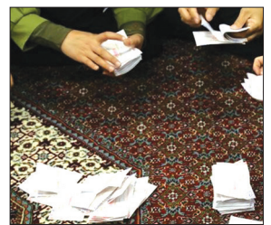
فرماندار کرج گفت: پس از بررسی‌های هیأت